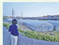
撤退で放置されたハウス

花見川区犢橋地区で国の補助金を活用し、ベビーリーフを生産していた企業が、度重なる浸水被害等で事業撤退。補助金が事業者から国へ返還されることになりました。